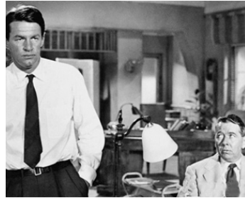
1959 TEMPÊTE SUR LA JAMAÏQUE (Passionate Summer) de Rudolph Cartier avec Richard Egan