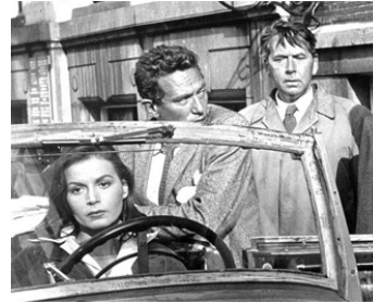
1959 OPÉRATION AMSTERDAM de Michael McCarthy avec Eva Bartok, Peter Finch