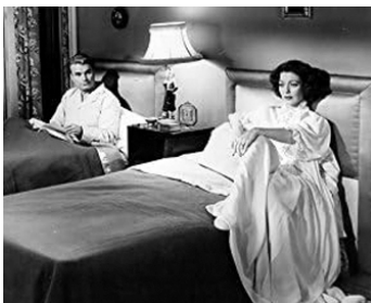
1952 PAULA (The Silent Voice) de Rudolph Maté avec Loretta Young