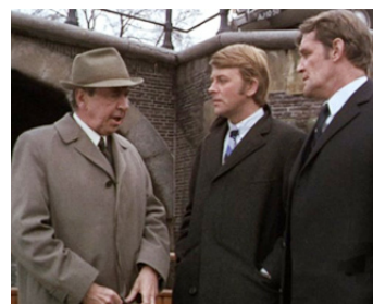
1970 NARCOTIC BUREAU (Puppet on a Chain) de Geoffrey Reeve avec Sven Bertil Taube