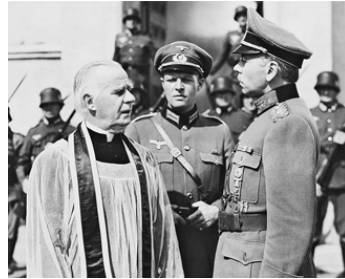
1944 PAS UN N'ÉCHAPPERA (None Shall Escape) d'A. De Toth avec H. Travers, Sven Hugo Borg