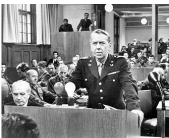
1967 LA VINGT-CINQUIÈME HEURE (The 25th Hour) d'Henri Verneuil