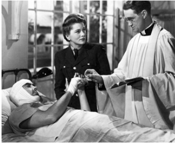
1942 ÂMES REBELLES (This Above All) d'A. Litvak avec Tyrone Power, Joan Fontaine