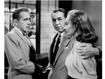
1950 TOKYO JOE (Tokyo Joe) de Stuart Heisler avec Humphrey Bogart