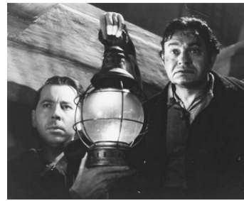
1941 LE VAISSEAU FANTÔME (The Sea Wolf) de Michael Curtiz avec Edward G. Robinson