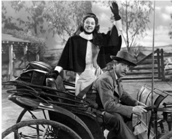
1946 SŒUR KENNY (Sister Kenny) de Dudley Nichols avec Rosalind Russell