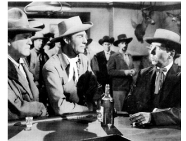
1951 LE CAVALIER DE LA MORT (Man in the Saddle) d'André De Toth avec Randolph Scott