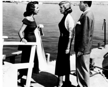
1951 L'IMPOSTURE (Two of a Kind) d'Henry Levin avec Terry Moore, Lizabeth Scott