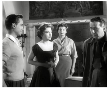
1958 L'HOMME À DÉMASQUER de M. Anderson avec Richard Todd, Anne Baxter, Faith Brook