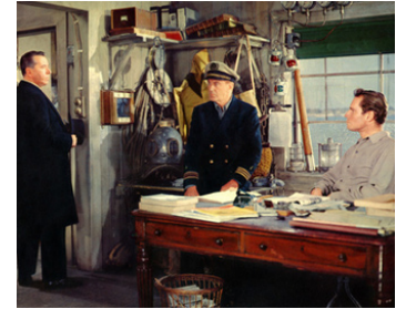
1959 CARGAISON DANGEREUSE de Michael Anderson avec Gary Cooper, Charlton Heston