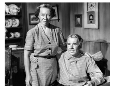
1957 MARÉE HAUTE À MIDI (High Tide at noon) de Philip Leacock avec Flora Robson