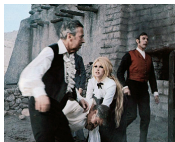
1968 SHALAKO (Shalako) d'Edward Dmytryk avec Brigitte Bardot