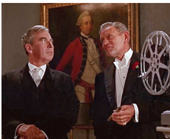
1965 MODESTY BLAISE (Modesty Blaise) de Joseph Losey avec Harry Andrews