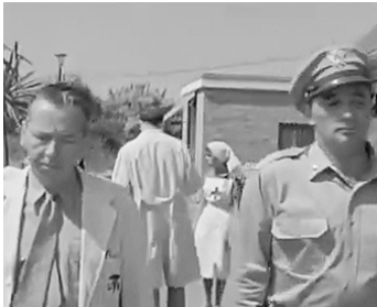
1963 L'AFFAIRE WINSTONE (Man in the Middle) de Guy Hamilton avec Robert Mitchum