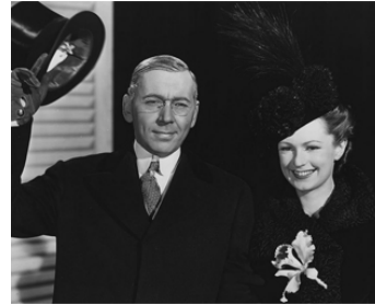
1944 WILSON (Wilson) d'Henry King avec Geraldine Fitzgerald