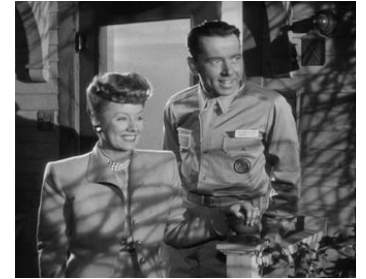
1945 DEUXIÈME JEUNESSE (Over 21) de Charles Vidor avec Irene Dunne