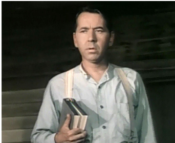
1950 L'ÉPREUVE DU BONHEUR (I'd climb the Highest Mountain) d'Henry King