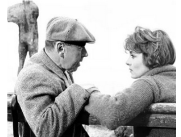
1963 LES DAMNÉS (The Damned) de Joseph Losey avec Viveca Lindfors