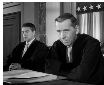
1953 LES HOMMES NE COMPRENDRONT JAMAIS (The Divided Heart) de Ch. Crichton