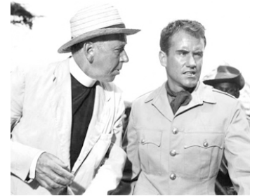
1965 L'AVENTURIER DU KENYA (Mister Moses) de Ronald Neame avec Ian Bannen