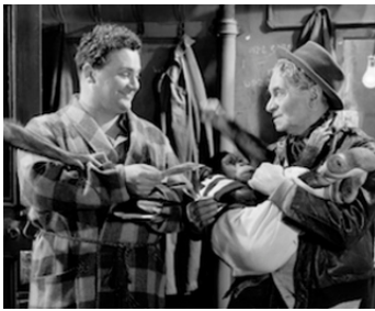
1957 DAVY (Davy) de Michael Relph avec Harry Secombe