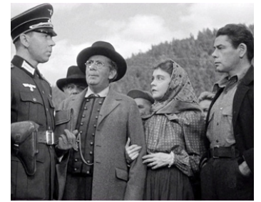
1942 LE COMMANDO FRAPPE À L'AUBE de J. Farrow avec R. Collins, L. Gish, P. Muni