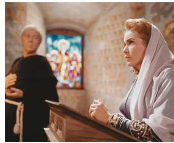
1958 LES VIKINGS (The Vikings) de Richard Fleischer avec Janet Leigh