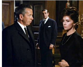
1964 LA FEMME DE PAILLE (Woman of Straw) de B. Dearden avec S. Connery, G. Lollobrigida