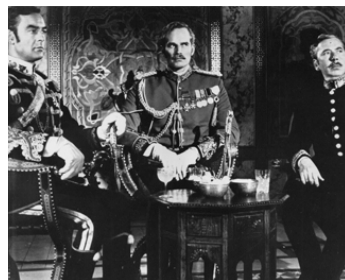
1966 KHARTOUM (Khartoum) de Basil Dearden avec Richard Johnson, Charlton Heston