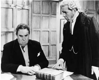
1960 OSCAR WILDE (Oscar Wilde) de Gregory Ratoff avec Robert Morley