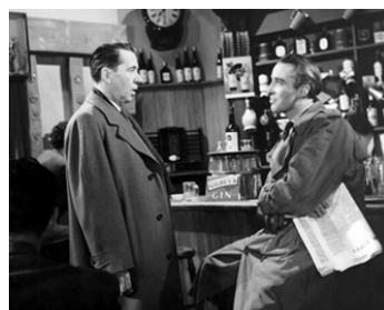
1956 ALIAS JOHN PRESTON (Alias John Preston) de David MacDonald avec Christopher Lee