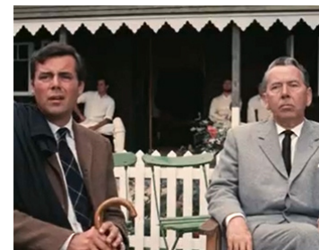
1966 L'ACCIDENT (Accident) de Joseph Losey avec Dirk Bogarde