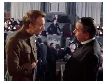
1971 NICOLAS ET ALEXANDRA (Nicholas and Alexandra) de F. Schaffner avec G. Rigaud