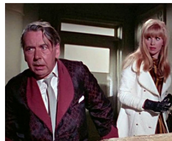
1966 POUPÉES DE CENDRE (The Psychopath) de Freddie Francis avec Judy Huxtable