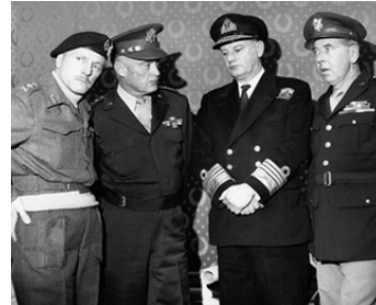
1962 LE JOUR LE PLUS LONG (The Longest Day) d'A. Marton avec T. Reid, H. Grace, J. Robinson