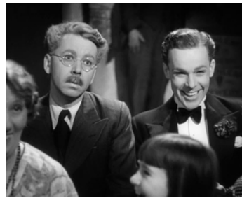
1939 CHEER BOYS CHEER de Walter Forde avec Peter Coke