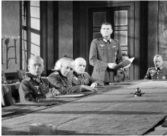
1958 CHEF DE RÉSEAU (The two-headed Spy) d'André De Toth avec Jack Hawkins