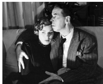
1952 EUROPE 51 (Europa '51) de Roberto Rossellini avec Ingrid Bergman