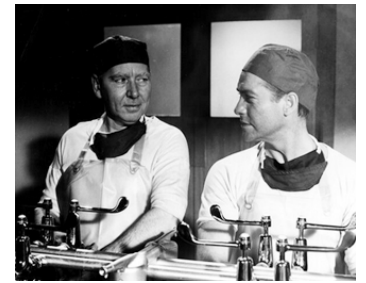
1958 TUEUR À GAGES (Intent to kill) de Jack Cardiff avec Richard Todd