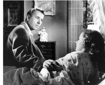
1948 LE SIGNE DU BÉLIER (The Sign of the Ram) de John Sturges avec Susan Peters