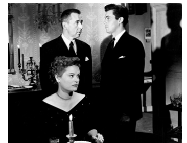
1954 LA BÊTE S'ÉVEILLE (The Sleeping Tiger) de J. Losey avec Alexis Smith, Dirk Bogarde