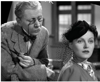
1938 THE GAUNT STRANGER de Walter Forde avec Louise Henry